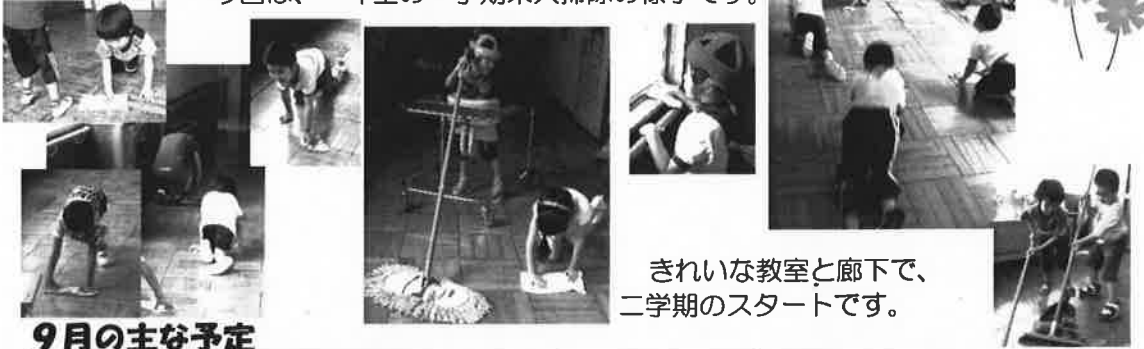
きれいな教室と廊下で、 二学期のスタートです。