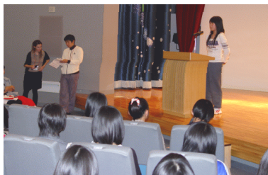
DAY 1 recitation contest (final)