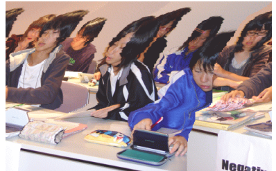
DAY 1 debate matches