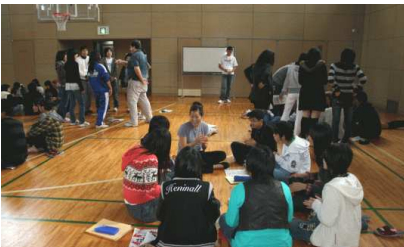
DAY 1 ice breaker