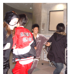
DAY 3 scavenger hunt