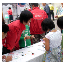
東京電力ボランティア