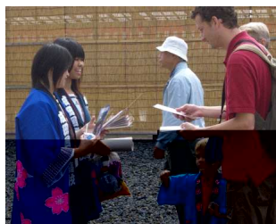
通訳ガイド 3年「英語表現」選択者も授業の成果を披露

人の来場者のあった成田弦祭りには1年生から3年生まで計31人(国際科25人)が協力し、通訳ガイドやイベントアナウンス、東京電力テントでのお手伝い、着物ショーのモデルなどを務めました。