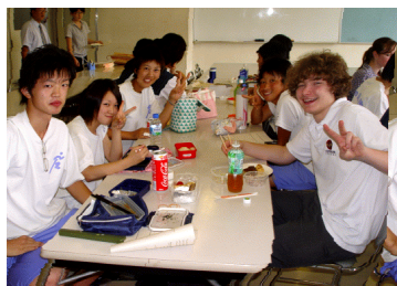
2G Group Talk