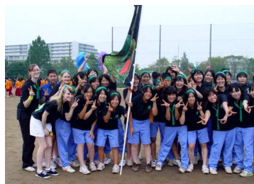
2F Sports Day