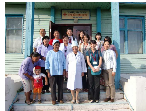
In front of the hospital in Bulgan

The ten days passed so quickly. However, it was a very productive and inspiring time for me. I would like to talk about what I learned in Mongolia in my classes, and I hope my experiences will inspire many students to see other countries.