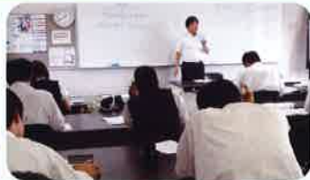
簿記（資格取得講座）