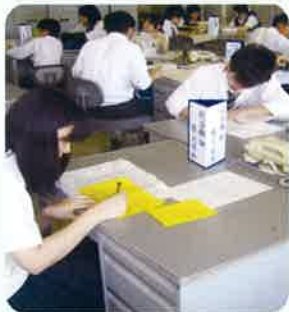
総合実践（模擬商店）