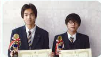
情報処理検定1級満点賞

人材不足の業界へ：IT・WEBデザイナー 基本情報処理試験2名合格・ITパスポート17名合格・ プログラミング（JAVA）1級18名合格・ ビジネス情報処理1級51名合格