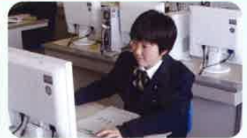
プログラミング（JAVA言語）