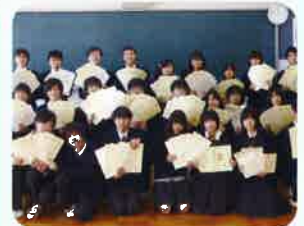
情報処理科（卒業時賞状）