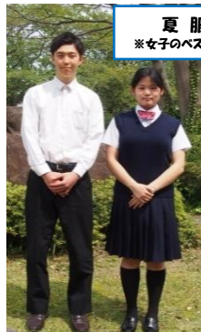
夏服 ※女子のベストは白