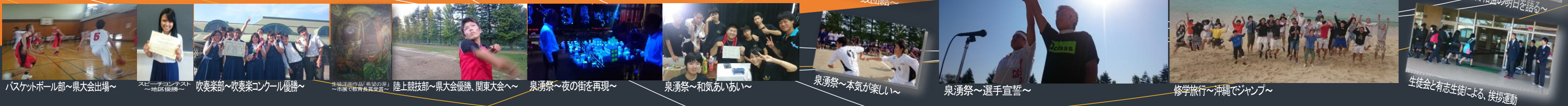
バスケットボール部～県大会出場～ スピードコンテスト～地区優勝～ 吹奏楽部～吹奏楽コンクール優勝～ 生徒会役員選挙～古和釜の明日を語る～ 陸上競技部～県大会優勝、関東大会へ～ 泉湧祭～夜の街を再現～ 泉湧祭～和気あいあい～ 泉湧祭～本気が楽しい～ 泉湧祭～選手宣誓～ 修学旅行～沖縄でジャンプ～ 生徒会と有志生徒による、挨拶運動