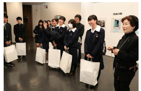
主催者から作品の講評を受ける