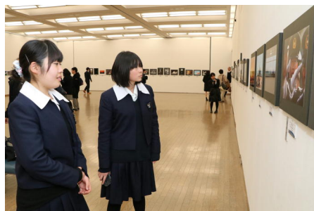
選りすぐりの作品を鑑賞