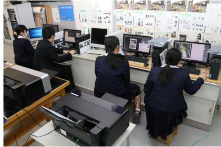
フォトショップで編集して印刷