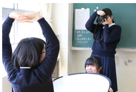
キャッチライトを意識しながら撮影