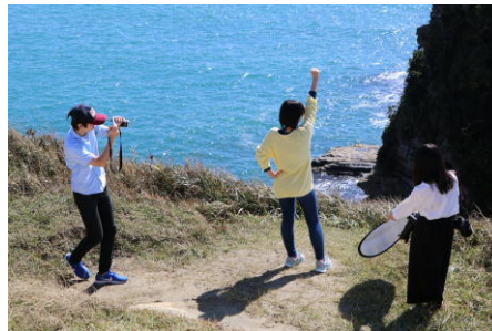
班に分かれてポートレート撮影を実施