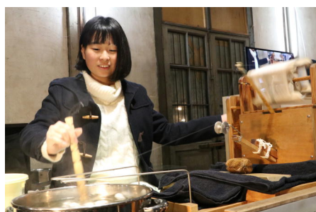
貴重な座繰り体験を行いました