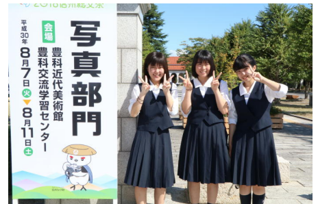
会場の豊科近代美術館で