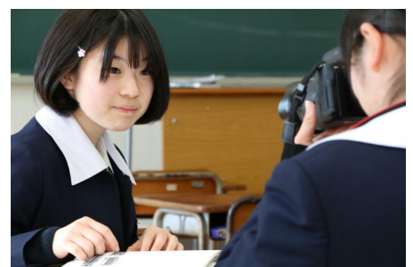
モデルとコミュニケーション