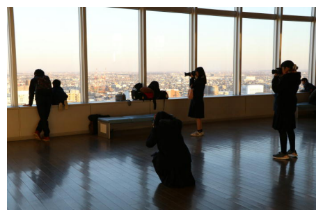
親子連れにモデルを依頼