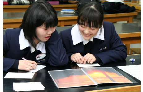
お互いの作品にコメントを記入