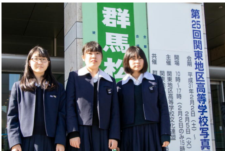
会場の高崎シティギャラリー