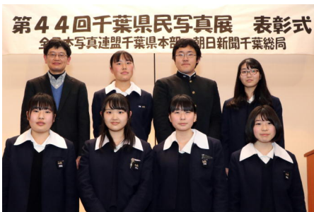
入賞者全員で記念撮影