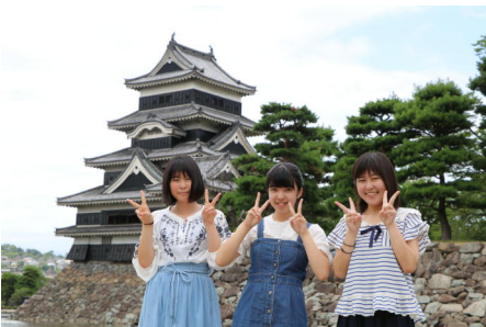
松本城の前で記念撮影