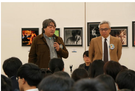
審査と講評・講演を担当された先生方