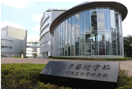
会場の日本大学芸術学部

千葉県高等学校文化連盟写真専門部会主催の第32回写真教室・撮影会に参加しました。県内の多くの高校写真部が日本大学芸術学部集まり、写真に関する専門的なご指導を受けることができました。