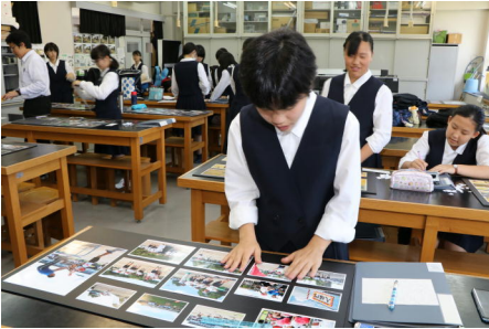
各自でテーマを設け、組写真を作成。

長生高校の文化祭である長高祭が実施されました。7月7日（土）に一般公開が行われましたが、多くの来場者に写真部の展示をご覧いただきました。