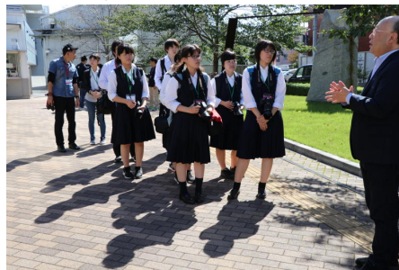
日芸の先生によるスナップ撮影のガイダンス