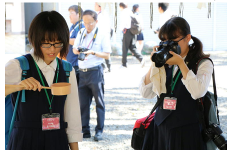
近くの神社でスナップ撮影