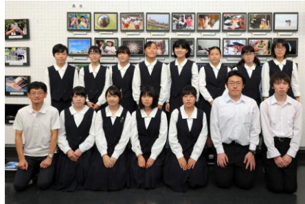
参加生徒全員で記念撮影