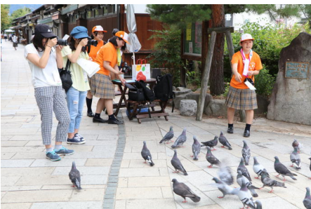
松本市内で行われた撮影会