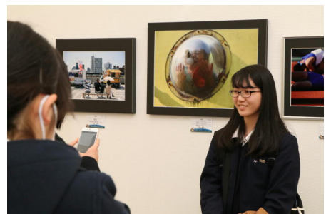
出展作品を前に記念撮影