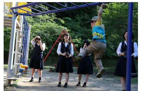
遊具で遊ぶ子どもカメラで追いました