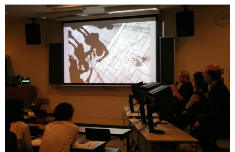
日芸の先生から作品の講評を受ける