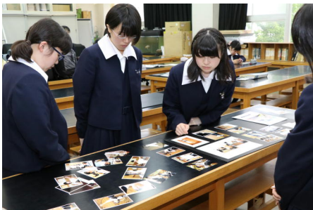
写真を作品にするためにレイアウト