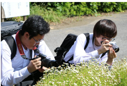
マクロ撮影に挑戦

定期考査の最終日に当たる5月24日の午後に、茂原公園及びその道中で撮影会を実施しました。1年生もカメラの扱いにはすでに慣れ、暑いぐらいの陽気でしたが、清々しい青空のもとで満足のいく写真を多く撮ることができました。