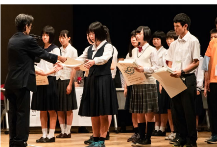
昨年度に引き続き、今年度も本校生徒が全国表彰されました。