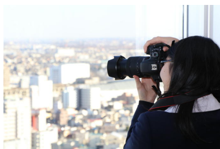
高崎市役所の展望ロビーにて