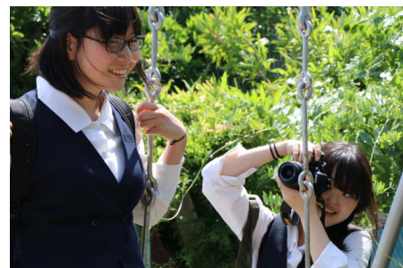
お互いをモデルに