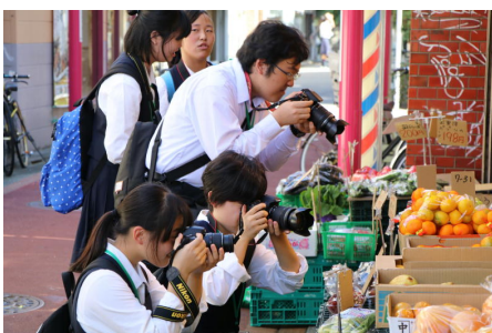
商店街に向いてスナップ撮影