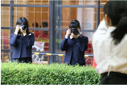
班ごとに部活動を決めて撮影をさせていただきました

今年度は10人の1年生が入部しました。早速先輩部員と班を組み、1つの部活動をテーマにした組写真をつくることにしました。新入部員は先輩達から撮影や印刷、そして作品編集の方法を教わりながら、1つの作品を完成させるまでのプロセスを体験することができました。どの班の作品も素晴らしく、後日行われた講評会でお互いの作品を批評しました。