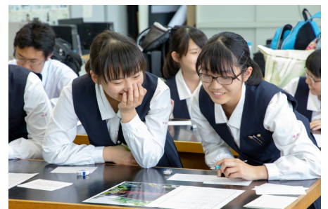
お互いの作品を見て記憶が蘇ります