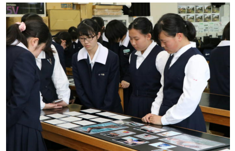
講評を読んで今後の参考に