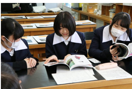
班ごとに撮影の事前計画

定期考査の最終日に当たる3月13日の午後に、校内の教室でポートレート撮影会を実施しました。効率よく撮影ができるように、写真集やテキストなどを参考に、どのようなポーズで撮るのが班ごとに計画を立てました。皆、納得のできる作品を撮影できたようです。