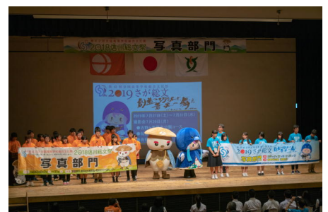
来年度のさが総文を目指して今後の活動もさらに頑張ります。