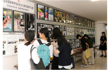
多くの方にご覧いただきました。