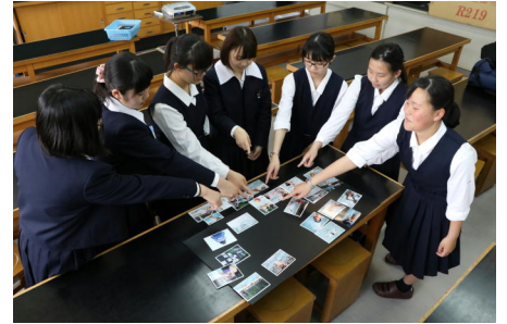
作品に使う写真を班ごとに選考