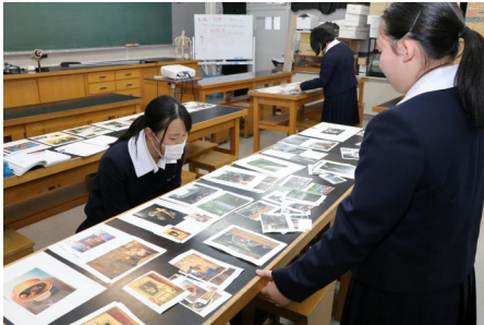
1枚ずつの写真を並べて構成を検討