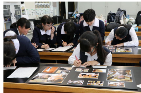
他の班の作品に対する講評を記入