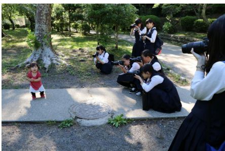
小さなモデルに皆夢中