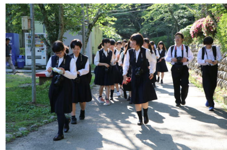
楽しかった茂原公園を後に帰路に