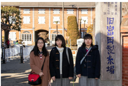
2日目に訪れた富岡製糸場