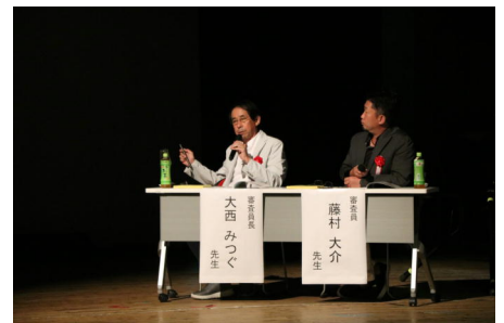
本校生徒の作品が奨励賞を受賞し、審査員から講評を受けました。