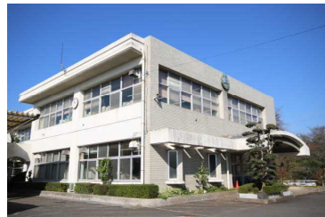
桜が丘特別支援学校

〒264-0017 千葉市若葉区加曽利町 1 5 3 8 TEL 043-231-1449 FAX 043-231-3069