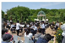
ローズガーデンコンサート時の様子

京成バラ園で、吹奏楽部が午前と午後の2回、コンサートを開催しました。園内は、ローズフェスティバル2019が開催されており多数の来場者の前で、アンコール曲を含め7曲演奏をしました。