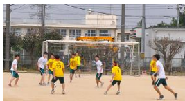
サッカー (サッカー場)