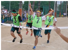
クラス対抗リレー

5月2日(水)、開催された平成30年度「体育大会」午後の部では、最初に長縄跳びを学年別に野球場で実施しました。5分間内に、連続して跳べた最高回数で勝敗を競いました。失敗しても何度も再開できるために、クラスのチームワークが試されました。