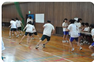
体育館で行われた、 反復横飛びの測定時 の様子

各会場では、運動部に所属している部員たちが補助生徒として活躍し、各測定がスムーズに行われていました。