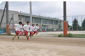
陸上競技場で行われた、 50メートル走の計測時 の様子