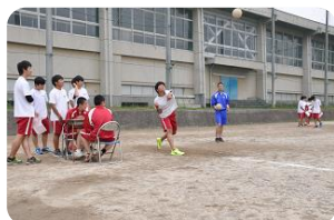
野球場で行われた、 ハンドボール投げ 計測時の様子