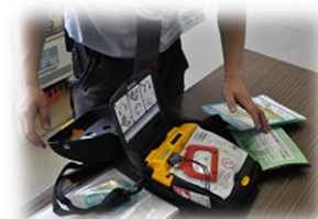
使用方法について 説明する業者