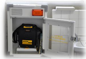
扉をむやみに開けると 警告音になります。