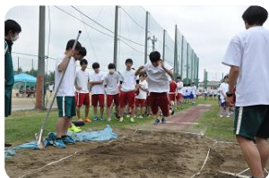
陸上競技場で行われた、 立ち幅跳びの計測時 の様子