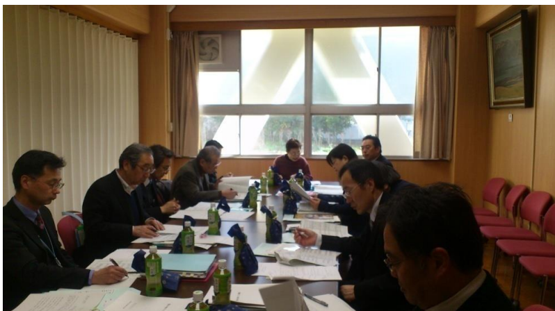
開かれた学校づくり委員会の様子

11月に実施した、学校評価アンケート(保護者、生徒、職員)等を用いてまとめた「自己評価」及び「改善方策」について、本校職員が説明を行いました。その後、委員の方から評価していただくとともに、生徒の様子について、生徒指導について、施設・設備について、中高一貫教育について、本校の在り方について等に関する御質問や御意見をいただきました。学校評価の結果は、後日本校ホームページに掲載します。