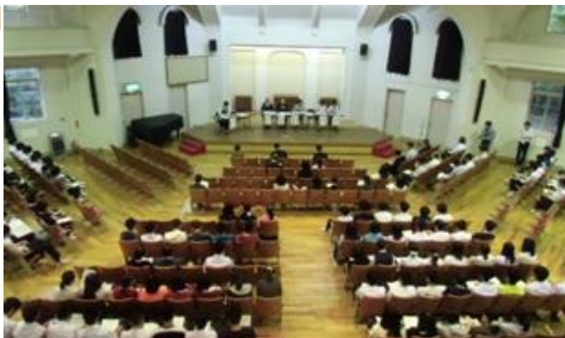
9月25日に実施した「地域懇談会」の様子

委員の方から、8月25日に行われた「開かれた学校づくり」研修会の報告をしていただきました。また、本校職員が9月25日に実施した地域懇談会について報告しました。