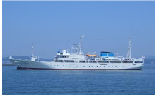
千葉県立高等学校実習船「千潮丸」(499t)