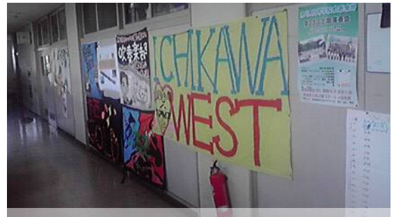
【ここから目指せ！ 吹奏楽の甲子園 普門館】