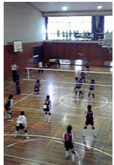
【対市立稲毛戦(若松高体育館)】