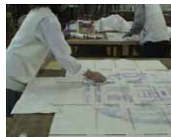
袖凧共同制作の様子

地元で伝わる袖凧を各個人で制作。またグループ(7 人程度)制作として袖凧・角凧(約 2 羽)を共同で制作した。