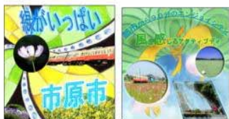
この2枚は、市長にあって、市役所に展示することになった。